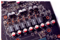
核心區域焊上 6 相供電，每相各設 2 顆 UBIQ QN3103 MOSFET 晶片，固態電容與鉅質電容並用。

散熱器主體由 40 枚鋁製鱗片構成，內建 2 條 6mm 銅製熱導管；熱導管部分範圍焊接至 4.5 x 4.5cm 銅底，藉着銅底快速傳導核心熱力，並配合雙 8.8cm 風扇（9 扇葉）降溫。「AMP」版屬於廠商高階型號，故核心 Boost 時脈達到 1,845MHz。值得一提是，在 4 款受測型號中，僅 MSI 及 ZOTAC 提供「1x HDMI 2.0 + 3x DP 1.4」視訊端子。