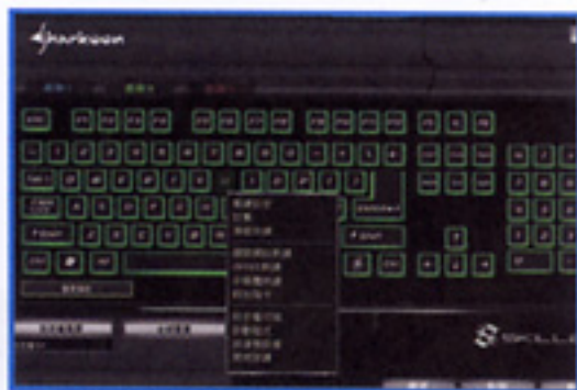
● 支援單鍵及巨集設定。