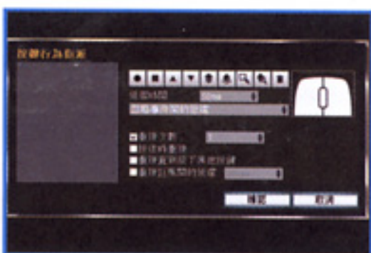
● 可以設定記錄模式，令按鍵可使用連環動作功能。