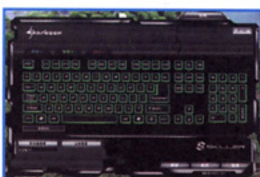
● 附送的軟件可以控制所有的按鍵設定修改功能。