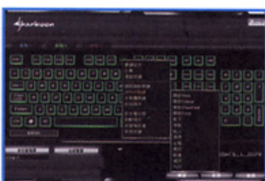
● 另外亦可設定為 Office 熱鍵。