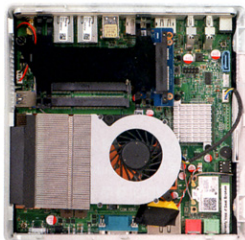
● 處理器上裝有大型散熱器連渦輪風扇。