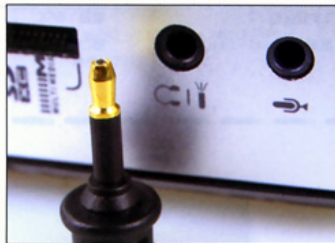
配合附送的轉換插，即可使用光纖音效輸出功能。