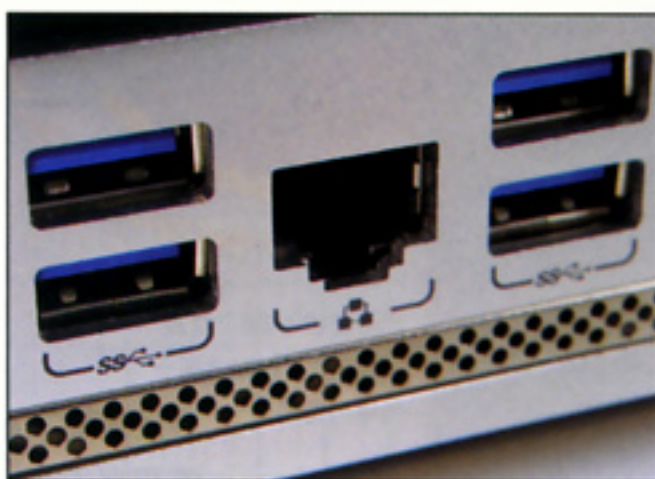
後方提供 4 個 USB 3.0 接口。