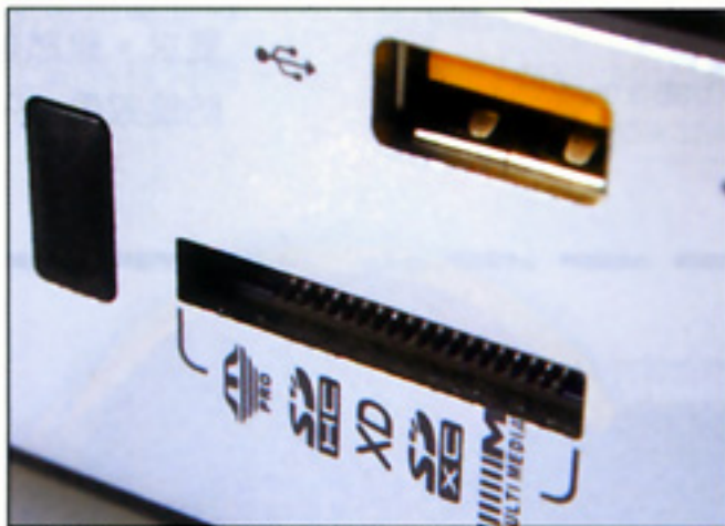
前置讀卡器同時支援 7 類不同的記憶卡。

網絡部分內置有 Gigabit LAN 規格的 RJ45 接口，以及 802.11n WiFi 網絡模組，並提供外置式天線，同時整合藍牙 4.0 功能，在無線連接部分功能可說是極之齊全。由於 Nano 十分適合作為 HTPC 使用，所以廠方不單提供掛牆架，供用家裝到電視機背部，以方便放置之外，音效輸出接口亦經過特別設計。ID 64 整合 7.1 音效晶片，另外為了配合高階玩家要求，後方的 3.5 吋喇叭輸出接口，只要配合附送的轉換頭，即可得到光纖輸出功能。同時前置提供有 7 合 1 讀卡器，現時主流的記憶卡均可直接讀取，方便用家在電視上瀏覽相片。輸出部分相當齊全，不單有 HDMI，而且亦提供 DisplayPort 功能，確保用家可以配合現時以及日後推出的電視連接之用。