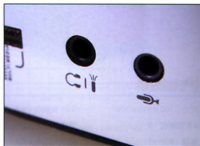
前置接口將喇叭及收音器分離，方便用家使用雙插頭的耳機。