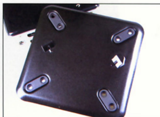
附送的掛機架，令用家可以直接將 Nano 掛到螢幕或電視後方。